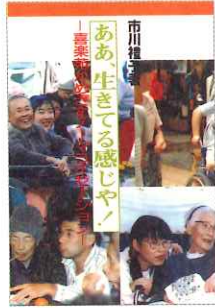
「ああ、生きてる感じがや」 -喜楽苑がめざす ノーマライゼーション- 1993年