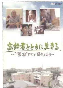
ターミナルケアの実践が NHK総合で放映 「にっぽんの現場」「ETV特集」 2006年