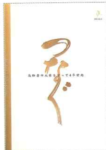
法人設立25年記念誌 「つなぐ」 -高齢者の人権を守って四半世紀- 2008年