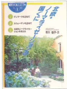
「北欧・ノーマライゼーションの国くに」 1990年