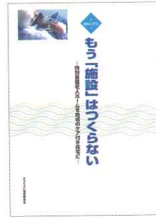
もう「施設」はつくらない -特別養護老人ホームを 地域のケア付き住宅に- 2000年