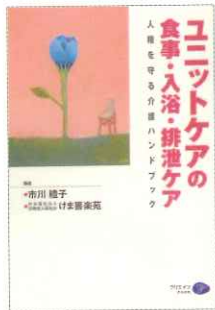
ユニットケアの 食事・入浴・排泄ケア -人権を守る介護ハンドブック- 2005年