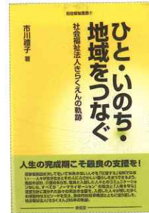
ひと・いのち・地域をつなぐ -社会福祉法人きらくえんの軌跡- 2015年