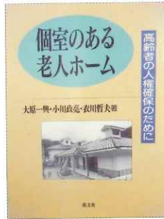
個室のある老人ホーム -高齢者の人権確保のために- 1995年