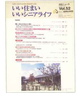
高齢者住宅財団 取材 ユニットケア・個室化の意義と これからの特養がめざす方向 -けま喜楽苑の実践- 2003年